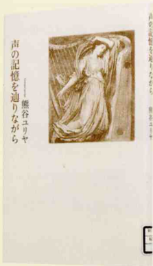
熊谷ユリヤ 著 思潮社 2010.6

ある朝、グランドハーブを調弦する私の耳元で、激しい音を立てて弦が切れた。その瞬間、長い間、書けずにいた日本語の詩が戻った。ハーブを効果音に弾き語りをするための詩「この惑星が熟して落ちて朽ち果てる前に」が出来上がったのは、詩集の表紙にある「ハーブと女」の銅版画を予備弦の箱に見つけたときだった。